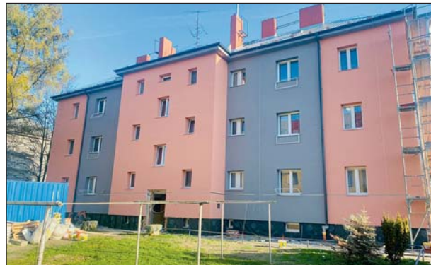
OPRAVENÁ FASÁDA zateplených domů v ulici Šimáčkově už svítí novotou.

Mariánské Hory a Hulváky spravují 159 obecních bytových domů s celkem 1 996 byty, a je tak největším poskytovatelem bydlení v obvodu. Od roku 2020 se již podařilo zateplit domy na dvaceti adresách a do zateplení i souvisejících úprav plánuje obvod v příštím roce vložit obdobnou částku jako v letošním roce.