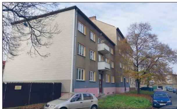
DOMY v ulici Oblá na zateplení ještě čekají.