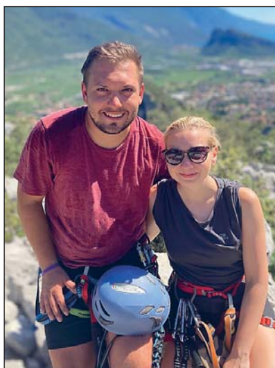
S MANŽELKOU po výstupu v horolezecké oblasti Arco v Itálii.

V naší zemi je navíc stavebnictví spjato s řadou kauz a afér, které mají přesah do politiky. Pro příklady z minulosti snad ani